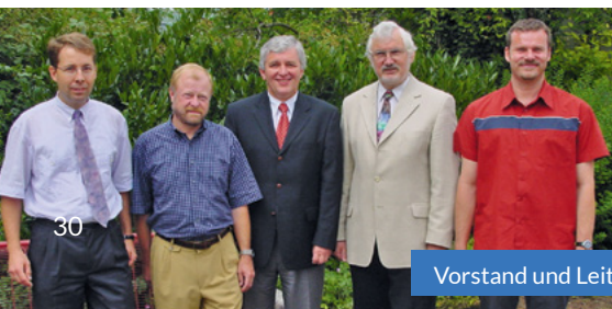
Vorstand und Leitungsteam 1999

Vorsitzender der Diakoniestation Remchingen e.V.