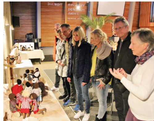
Oben Konfirmation im März 2023