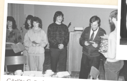
Görlitz Gründung 1991