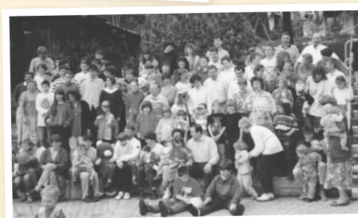
Freizeit in Hasliberg 1995