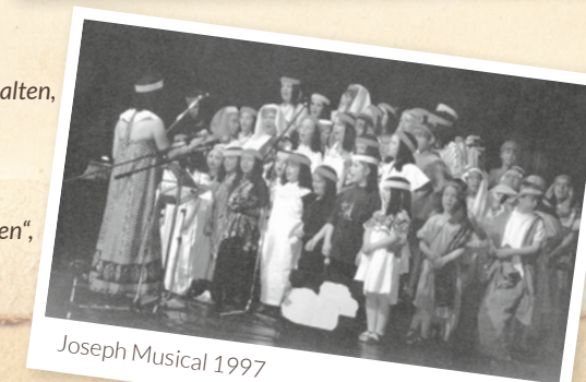
Joseph Musical 1997