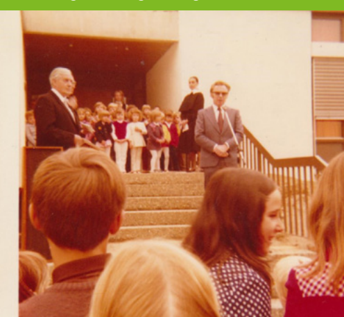
Eröffnung des Evang. Kindergartens Im Grund 1973

Erzieherinnen des Kindergartens Arche Kunterbunt